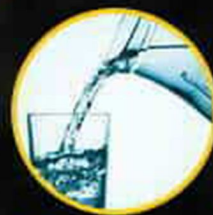
تصفیه آب آشامیدنی